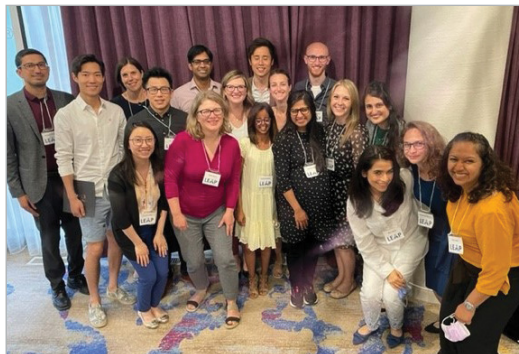
La cohorte LEAP 2020-2022 lors de sa réunion de clôture.

Le sous-comité de la formation professionnelle continue (FMC) a renouvelé son engagement ( https://rheum.ca/fr/education/aims-goals-and-mission-statement-of-the-cra-cpd-subcommittee/ ) à être un fournisseur de FMC accrédité par le Collège royal ( https://www.royalcollege.ca/rcsite/cpd/royal-college-accredited-cpd-providers-f ) avec la croissance du matériel de formation pour les réviseurs au sein de l'équipe et l'accréditation active des activités internes et externes en rhumatologie, rassurant ainsi les membres quant à la qualité du matériel de développement professionnel continu. Le sous-comité a également pris des mesures pour s'assurer que les membres sont informés des possibilités offertes par le programme de Maintien du certificat du Collège royal ( https://www.royalcollege.ca/rcsite/cpd/maintenance-of-certification-program-f ). Au cours de la dernière décennie, le prix de Réflexion sur la pratique a bénéficié d'un soutien constant. Ce n'est qu'un des projets visant à aider les membres de la SCR à obtenir de précieux crédits au titre de la section 3.